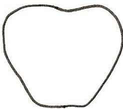
Achterkant appel 1 x rood

De appeltjes zijn ook leuk tussen de herfstboom met blaadjes.